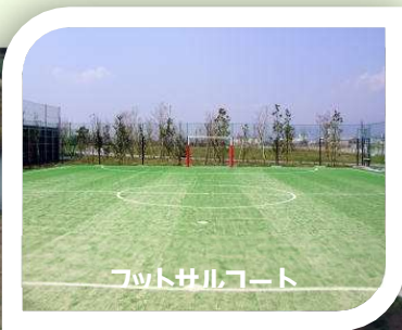
フットサルコート