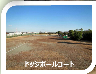
ドッジボールコート